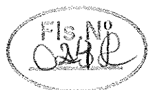
Valdevino de Souza Prefeito Municipal