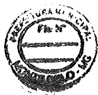
COMPRE BEM DISTRIBUIDORA EIRELI